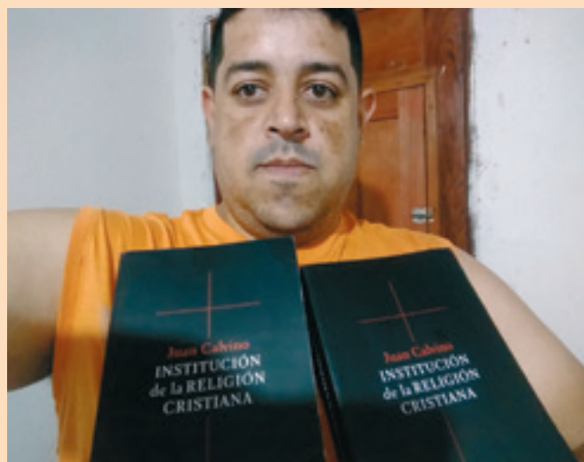
HILRAKSON BRASILEIRO (Brazilië)

Ik schrijf u deze brief ook om te vragen of u nog andere exemplaren met andere thema's uit uw collectie kunt sturen. En natuurlijk ook dat God dit prachtige werk blijft zegenen.