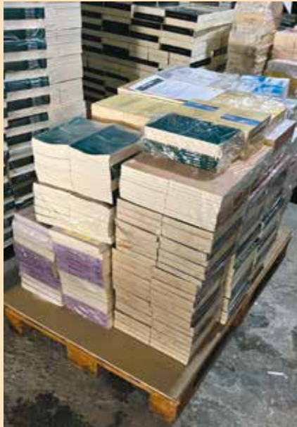
Boeken klaar voor verzending

Christus zien) of we iets strategisch kunnen doen om Felire bekendheid te geven. Ik zal het je laten weten. Het zou fantastisch zijn. De conferentie vindt plaats 11 en 12 oktober op de campus van de Universiteit van Medellín. Voor nu kun je alvast iets bekijken via de link https://muestraacristo.com en www.youtube.com/@muestraacristo/ videos. Dit is een jaarlijkse conferentie die